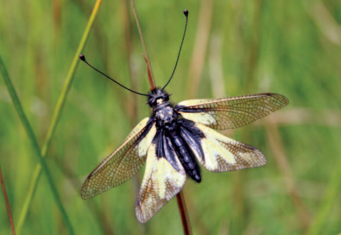
Abb. 1: Schmetterlingshaft ( Libelloides coccajus ). Dieses wärmelebende und ausgesprochen gewandte Fluginsekt erinnert mit seinem Aussehen zwar an einen Schmetterling, ist allerdings zur Ordnung der Netzflügler zu zählen, innerhalb derer es eine eigene Familie der Schmetterlingshafte ( Ascalaphidae ) gibt.