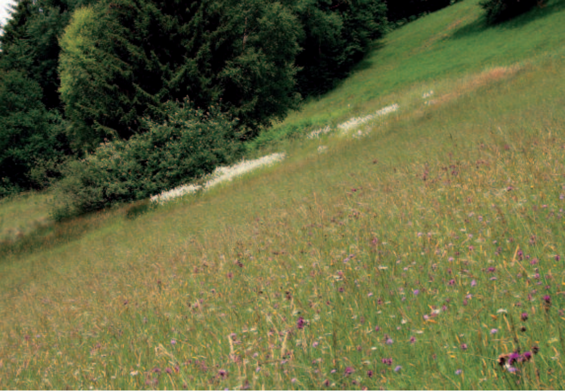
Abb. 4: Ein Beispiel für die enge Verzahnung von Trocken- und Feuchtlebensräumen wie sie für den Jagdberg typisch ist. Treppenwiesen an den Hängen oberhalb des Schnifner Plattenhofs mit eingesprengtem Quellsumpf (erkennbar an den weißen Fruchtständen des Breitblättrigen Wollgrases). (Foto: A. Beiser).

Diese naturräumlichen Grundlagen werden durch noch bestehende Reste der traditionellen agrarisch geprägten Kulturlandschaft mit teils noch extensiver Bewirtschaftung überformt. Das schafft auch die als angenehm empfundene Wald-Grünlandverteilung mit ihrem lieblichen Aspekt. Das I-Tüpfelchen für die Vielfalt bilden die höchsten Lagen, wo sich ergänzend eine alpine Szenerie ergibt. Die höchsten Bergspitzen reichen gerade noch über die natürliche Waldgrenze hinaus. Das ist also die Mischung, aus der sich die Vielseitigkeit und Eigenart der Jagdberggemeinden zusammensetzt und ihr unverwechselbares Alleinstellungsmerkmal darstellt.