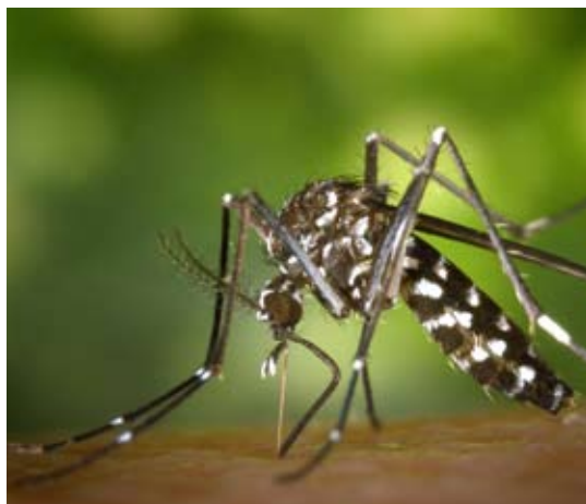
Unangenehm: Die asiatische Tigermücke gilt als einer der Überträger des Dengue-Fiebers, welches bei schwerem Verlauf auch tödlich enden kann. Europa blieb bisher von diesem Fieber weitgehend verschont, 2010 gab es allerdings die ersten Fälle in Südfrankreich und Kroatien.

Auch wenn heutzutage für die rasche Ausbreitung verschiedener Tier- und Pflanzenarten andere Faktoren – wie etwa die Verschleppung über globale Handelsrouten oder den Tourismus – hauptverantwortlich sein mögen, etablieren können sich diese Arten erst, wenn die klimatischen Bedingungen ihren Ansprüchen entsprechen.