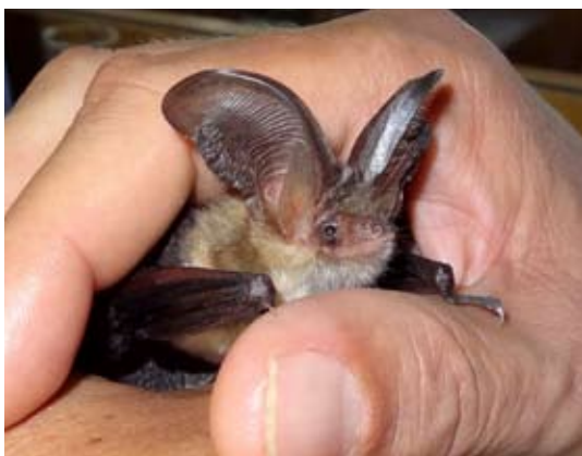
Langohr-Fledermäuse ( Plecotus sp.) fliegen in geringen Höhen sehr wendig nahe an der dichten Vegetation und manövrieren geschickt auch im Unterholz.

Die Untersuchungsgebiete waren über das ganze Ländle verteilt. Um vergleichbare Daten zu erhalten, mussten alle Gebiete in einem eng begrenzten Zeitraum bei ähnlichen Witterungsbedingungen untersucht werden. Die Tiere mit Netzen zu fangen war dafür zu zeitintensiv. Für uns Menschen sind die Ultraschallrufe (meist) unhörbar, mit denen sich Fledermäuse orientieren und ihre Nahrung finden. Mittels Ultraschall-Detektor haben die Forscher sie aufgezeichnet und ausgewertet. Die einzelnen Arten oder zumindest Artgruppen lassen sich so unterscheiden. Größe, Fluggeschwindigkeit und Verhalten liefern weitere Hinweise zur Bestimmung. Zwischen 8. Juni und 15. Juli 2010 wurden die 12 Untersuchungsflächen nach einem definierten Schema begangen.