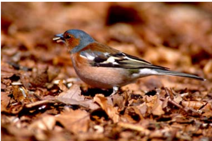
Die Sieger 2012: 931 Buchfinken wurden heuer in Vorarlberg gezählt.