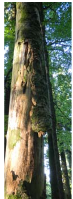
Die abstehende Borke eines beschädigten oder kranken Baumes bietet wichtige Quartiermöglichkeiten für «Waldfledermäuse».