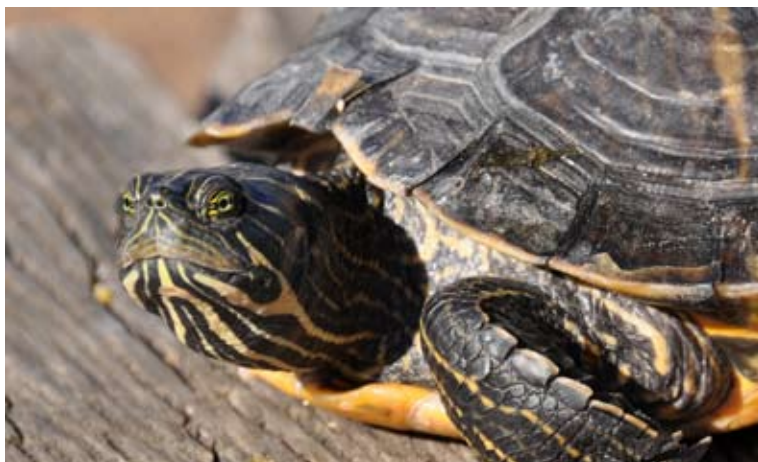
Relaxt: Auch wenn diese Schmuckschildkröte keinen wirklich gefährlichen Eindruck hinterlässt: Da immer mehr von diesen Tieren ausgesetzt wurden, wurde ihre Einfuhr 1997 EU-weit verboten. Mittlerweile konnte eine erfolgreiche Fortpflanzung in freier Wildbahn in Mitteleuropa nachgewiesen werden.