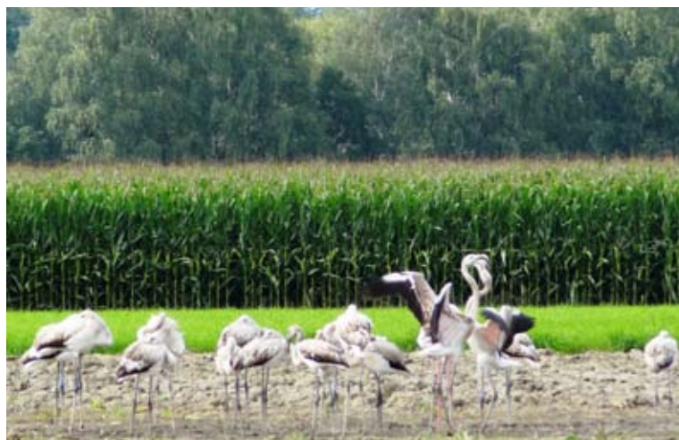
Rosaflamingos bei ihrer Rast in Meiningen: Nur der Altvogel weist die typische Rosafärbung auf.