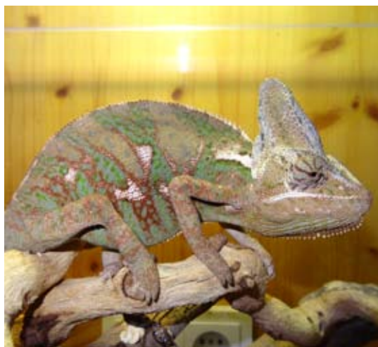
Die Exotenproblematik hat viele Facetten: Dieses Yemenchamäleon – ausgebüxt oder absichtlich freigesetzt – verursachte einen Verkehrsunfall, als es in Bludenz eine Straße überqueren wollte.