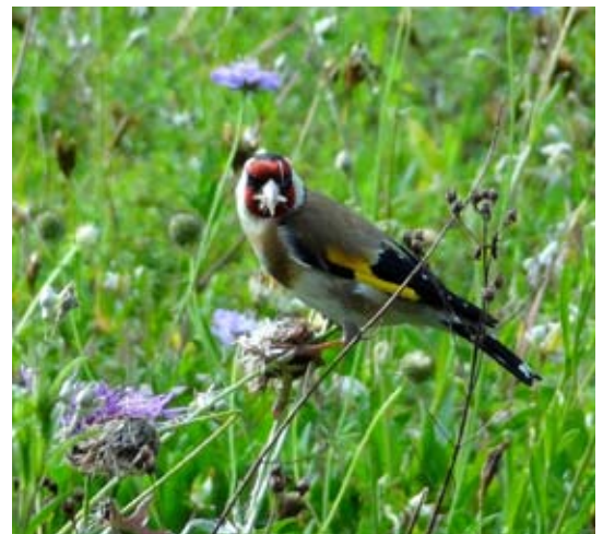
Für Stieglitze bietet die Ruderalflur im inatura-Stadtpark ganzjährig ausreichend Nahrung.