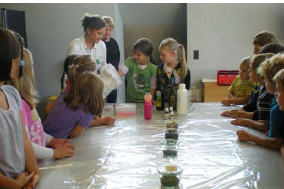
Es ist angerichtet für die Herstellung von Seifen mit unterschiedlichsten Duftnoten: Das Jukebox – Programm «Seifenoper» erfreut sich großer Beliebtheit.