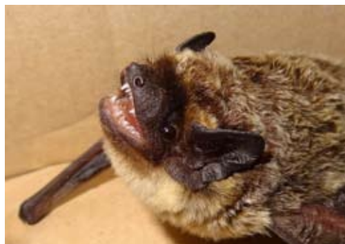
Die Zweifarbfledermaus ( Vespertilio murinus ) ließ sich anhand der Ortungsrufe nicht sicher bestimmen. Die saisonal weiträumig ziehende Art ist eher im Herbst zu erwarten.