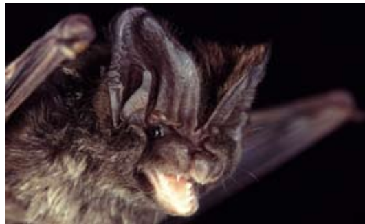
Die Mopsfledermaus ( Barbastella barbastellus ) ist eine typische Waldbewohnerin.