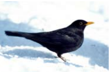
Den Amselbeständen in Vorarlberg geht es gut, in weiten Teilen Deutschlands wurden sie durch das Usutu-Virus stark dezimiert.