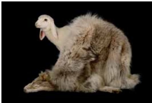
Der Wolf im Schafspelz oder doch eher umgekehrt?