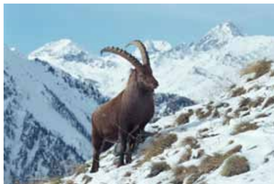
Einer unserer Schwerpunkte in der kalten Jahreszeit: Überwintern im Hochgebirge.

Unser Winterprogramm widmet sich heuer den Überlebenskünstlern im Hochgebirge. Gerade dort war der vergangene Winter gekennzeichnet durch enorme Schneemassen. Wie können Tiere und Pflanzen mit diesen Extremen umgehen? Welche Strategien haben sie sich dafür zurechtgelegt? Ein Workshop zum Staunen, der aber auch die Grenzen der einzelnen Arten aufzeigt.