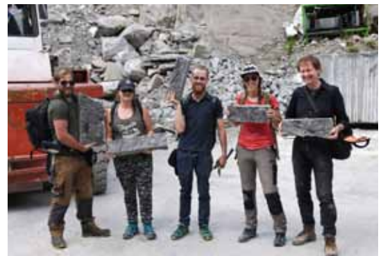
Exkursionsteilnehmer präsentieren vor dem Steinbruch Schwarzachtobel Sandsteinplatten mit inkohltem Pflanzenhäcksel.