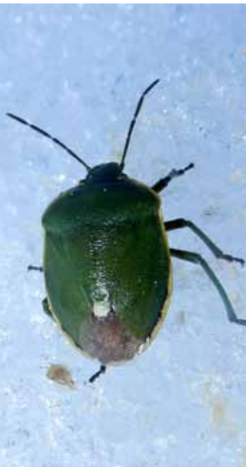
Erst der zweite Nachweis der Baumwanze Chlorochroa juniperina für Vorarlberg und dies auf einem Schneefeld im Tannberggebiet.

Bei Wanzen scheiden sich die Geister: Bettwanzen sind der Schrecken eines jeden Beherbergungsbetriebs, Baumwanzen machen sich durch ihren Gestank unbeliebt, Raubwanzen haben das Potenzial Krankheiten zu übertragen, und manche Wanzen können Schäden an Kulturpflanzen anrichten. Blendet man diese negativen Aspekte aus, so sind Wanzen faszinierende Tiere, die es wert sind, sich näher mit ihnen zu beschäftigen. Eine der jüngsten Publikationen in der Reihe »inatura Forschung online« ist daher den Wanzen gewidmet. Nicht die Erkenntnisse eines konkreten Forschungsprojekts stehen im Mittelpunkt, sondern Streudaten, die zufällig und ohne Plan erhoben worden sind. Nicht wenige der angeführten Beobachtungen stammen aus Anfragen an die inatura-Fachberatung – besonders im Herbst fallen Wanzen als Lästlinge auf, wenn sie auf der Suche nach einem Überwinterungsquartier in Häuser einzudringen versuchen. Neben der heimischen Grauen Gartenwanze ( Rhaphigaster nebulosa ) sind dies insbesondere als Neankömmlinge die Marmorierte Baumwanze ( Halyomorpha halys ) und die Amerikanische Zapfenwanze ( Leptoglossus occidentalis ).