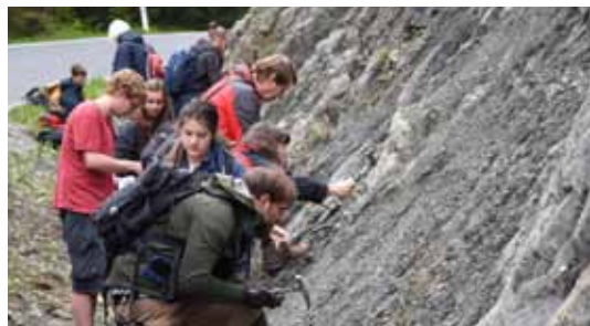
Die Molasse bei einem Straßenanriss am Bödele wird genauer untersucht.

Vorarlberg ist anders. Hier stehen Gesteine an, die man weiter im Osten vergeblich suchen wird. Ihnen galt das Hauptaugen-