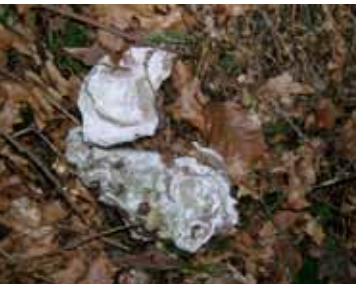
Austernschalen aus dem Wirtatobel

Auf meiner ersten Exkursion als Student stellte unser Professor eine einfache Frage: »Warum sind wir hier?«. Was haben wir uns um eine ausgeklügelte, ja philosophische Antwort bemüht! Doch das Naheliegende fiel uns nicht ein: »Weil wir NATURWissenschaftler sind«! So merkwürdig ich diesen Einstieg ins Studium empfand – ich nahm die Antwort ernst und war auf jeder Exkursion mit dabei. Inzwischen wurde das Studium verschult, und nach sechs Semestern ist der (Zwischen-)Abschluss fällig. So ging auch das Exkursionsangebot zurück, und damit das Lernen im Gelände. Wo die Universitäten zurückstecken, springt die Österreichische Paläontologische Gesellschaft ein. Sie hat sich zum Ziel gesetzt »die Interessen von Hobby-Paläontologen und professionellen Wissenschaftlern zu verbinden und den Kontakt untereinander zu fördern«. Dazu dienen auch Exkursionen zu Fossilfundstellen in ganz Österreich.