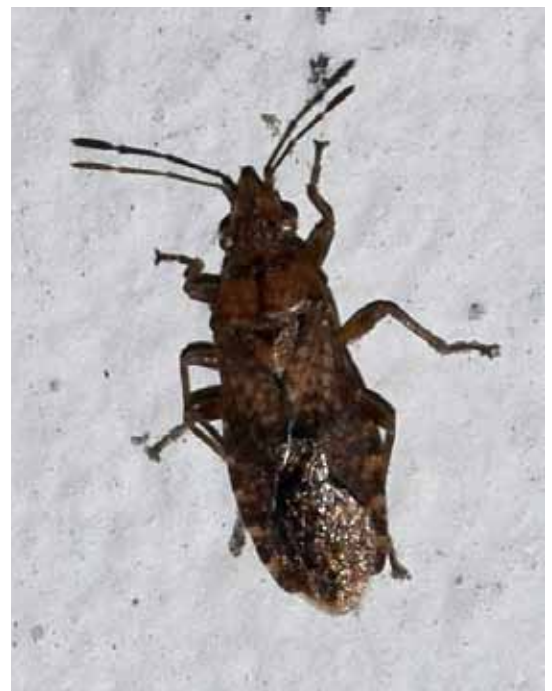
Die ursprünglich mediterrane Art Orsillus depressus etabliert sich zunehmend auch nördlich der Alpen.