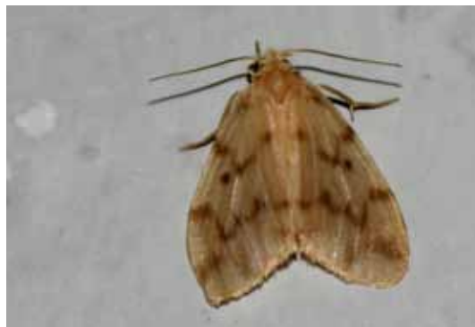
Das sehr seltene Blankflügel-Flechtenbärchen ( Nudaria mundana ) an einer Hauswand in Hohenems.