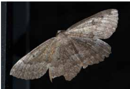
Der Große Steinspanner ( Gnophos furvata ) wird von künstlichen Lichtquellen angezogen. Die fehlende Dunkelheit in unseren Siedlungen kann vielen Arten zum Verhängnis werden.