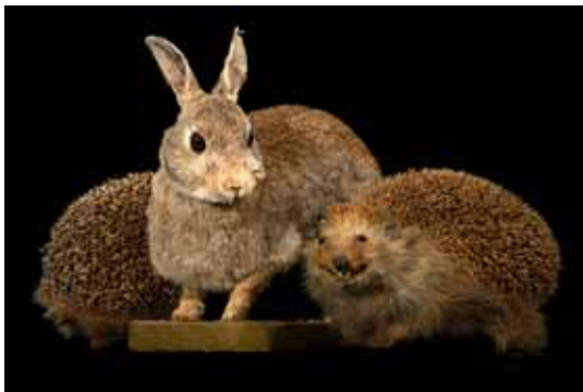
Wer ist schneller, zwei Igel oder ein Hase?

Die restliche Ausstellung bleibt während der gesamten Zeit geöffnet.