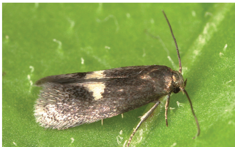
Perittia herrichiella.