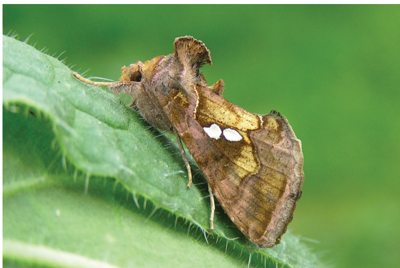
Chrysodeixis chalcites.