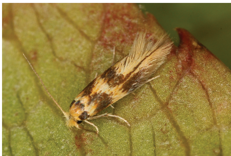
Bucculatrix thoracella.