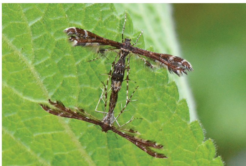
Capperia fusca.