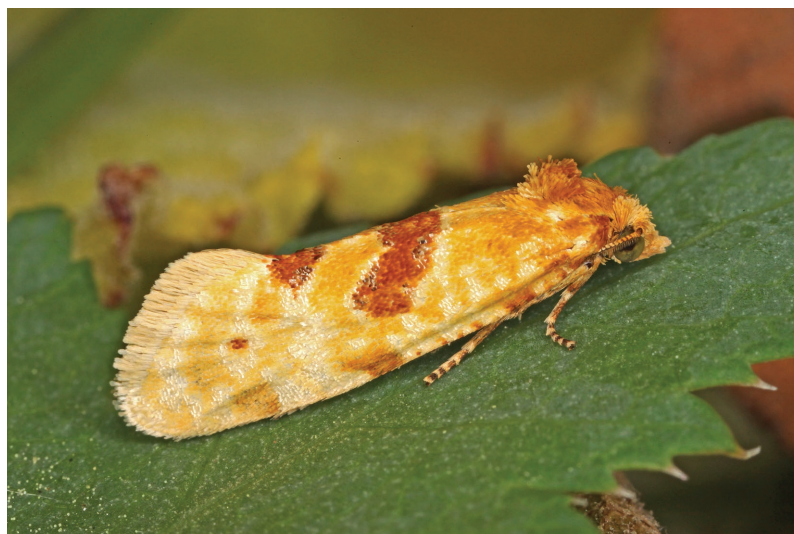
Aethes ardezana.

Der aus dem Engadin beschriebene Wickler wird von SCHMID (2019) als sehr lokal und selten bezeichnet. Die Verbreitung ist disjunkt, neben dem Alpenbogen gibt es weitere Vorkommen auf der Iberischen Halbinsel sowie am Balkan. Die Raupe entwickelt sich endophag in Stängeln von Berg-Laserkraut ( Laserpitium siler ).