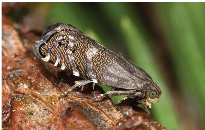
Cydia conicolana.