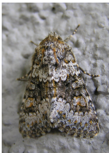
Hecatera dysodea.

• Planken, Blockhütte/Parkplatz an der Gafadurastrasse, 920 m SH: 26.06.2021 (1 Ex. LF) • Vaduz, Bergstrasse/Schwefelwald, 745-750 m SH: 13.09.2022 (3 Ex. LF) • Balzers, Ellwiesen, 560 m SH: 23.09.2022 (6 Ex. LF)