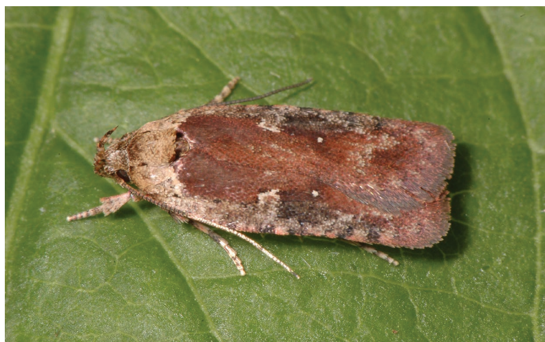
Agonopterix purpurea.

Alle im Gebiet nachgewiesenen Arten werden ausführlich bei KOSTER & SINEV (2003) besprochen.