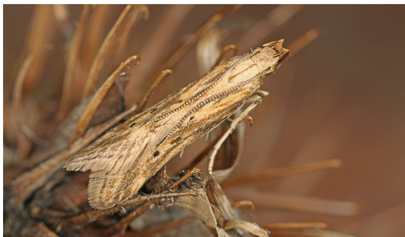
Metzneria lappella.