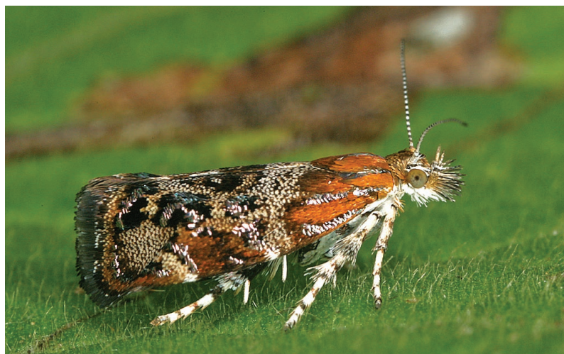
Tebenna bjerkandrella.

Vertiefende Angaben etwa zur Gesamtverbreitung und Raupennährpflanzen können RAZOWSKI (2001) entnommen werden.