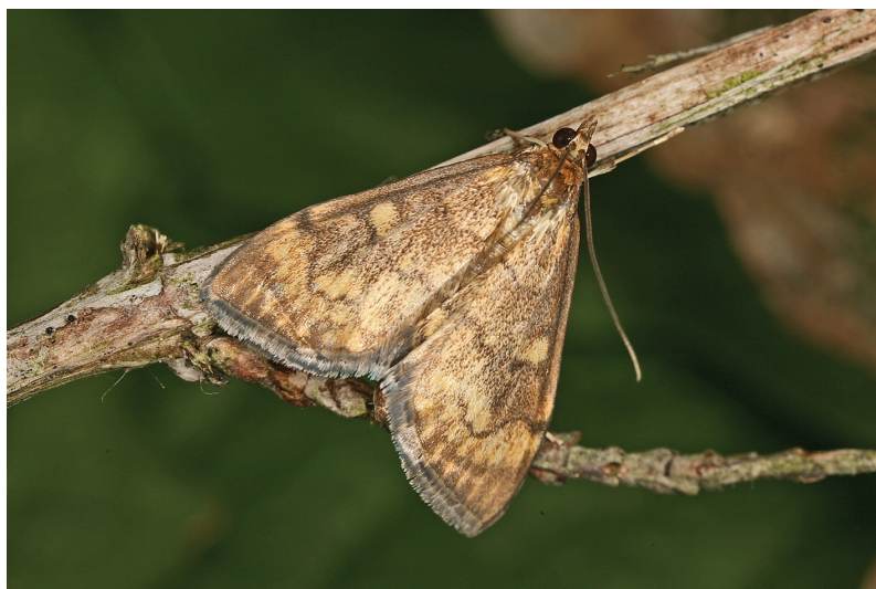
Anania verbascalis.