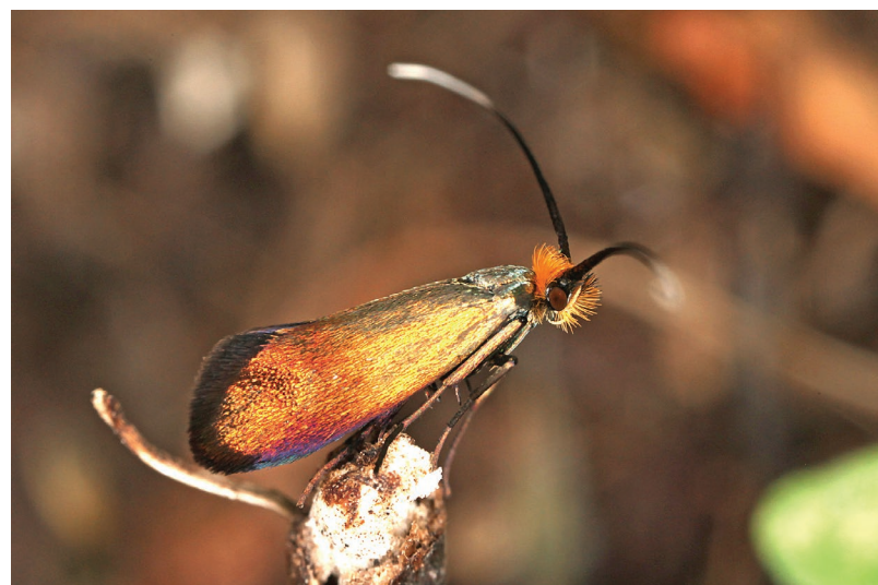
Nemophora cupriacella.