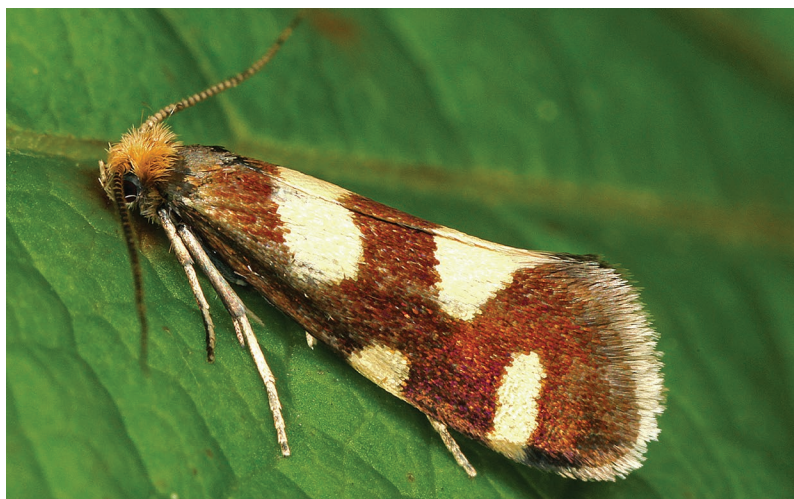
Lampronia rupella.