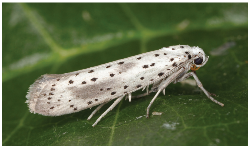
Yponomeuta irrorella.