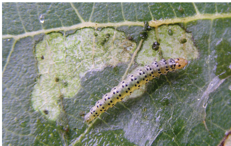
Choreutis nemorana – Raupe und Fraßbild.