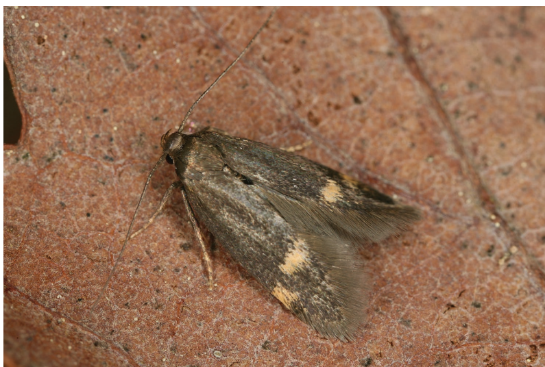
Borkhausenia minutella.