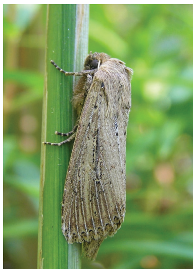
Nonagria typhae.

• Schaan, Quaderrüfe, 490-500 m SH: 07.08.2022 (1 Ex. LF)