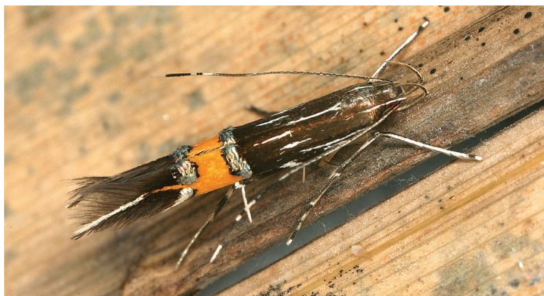
Cosmopterix scribaiella.

Die inzwischen aus vielen europäischen Ländern gemeldete Art wurde erst vor wenigen Jahren als eigenständiges Taxon erkannt. Die Kenntnis