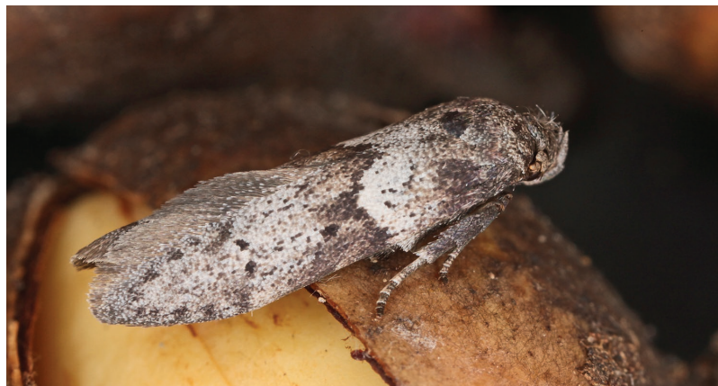
Blastobasis glandulella.