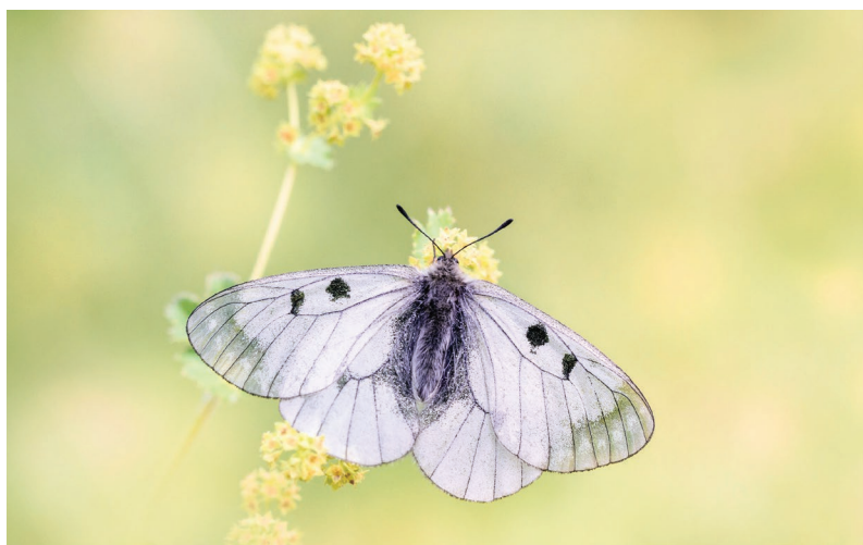
Parnassius mnemosyne.