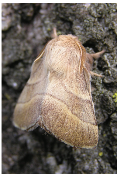
Malacosoma neustria.

(entlang der Staatsgrenze), 430 m SH: 07.06.2018 (3 ♂ LF), 21.06. & 22.07.2020 (je 1 ♂ LF)