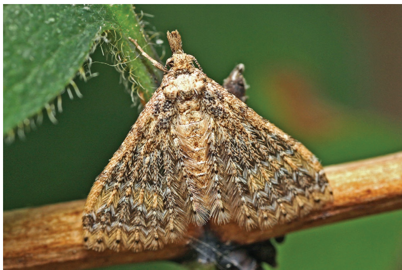
Pteropteryx dodecadactyla (Foto: Rudolf Bryner).