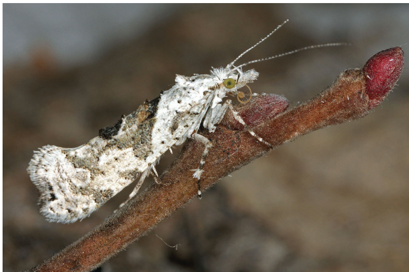
Ypsolopha asperella.

Als Raupennährpflanzen werden eine Reihe holziger Rosaceae genannt. Die Verpuppung erfolgt in einem gattungstypischen spindelförmigen Kokon (LEPIFORUM 2022).