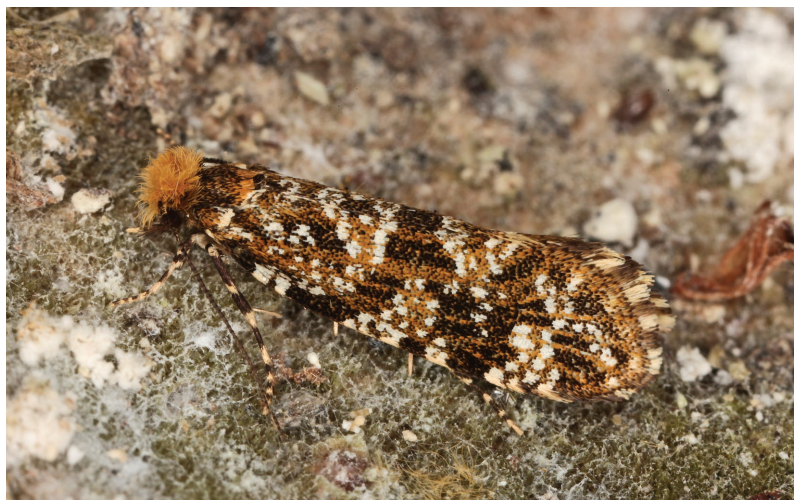
Triaxomera parasitella (Foto: Rudolf Bryner).