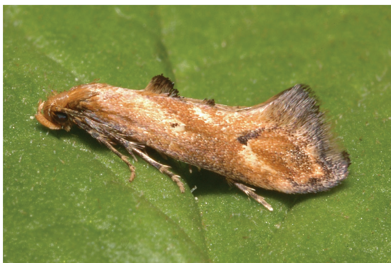
Epermenia illigerella.