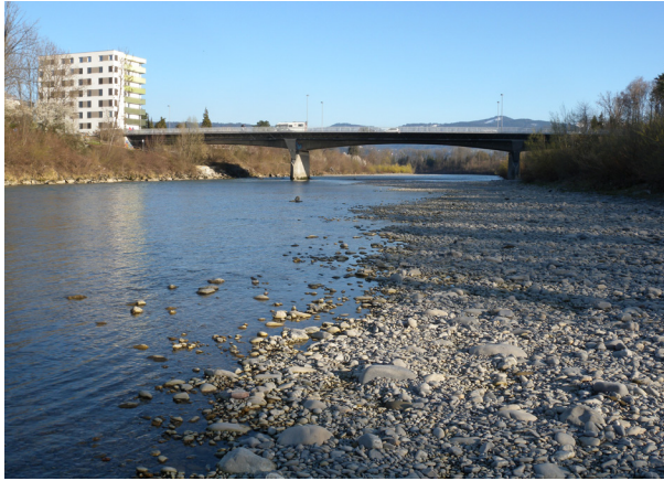
Abb. 6: Bregenzerach, Achsiedlung, Bregenz (10), flussaufwärts, 29.03.2019.