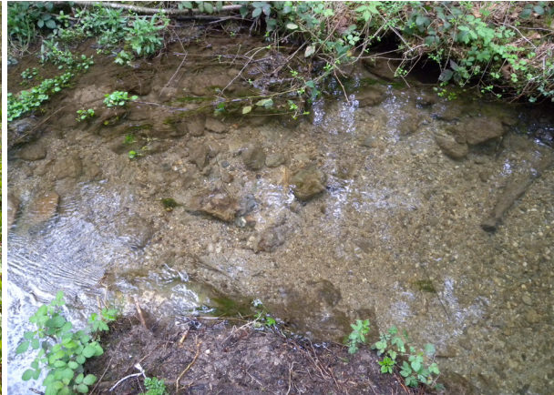
Abb. 5: Walsbächle, Röns (62), Fließrichtung nach links, 15.05.2019.

und das Walsbächle bei Röns (62) (Abb. 5) mit je acht Arten gut vertreten. Die beiden Gewässer wurden bei den vorliegenden Untersuchungen erstmalig beprobt.