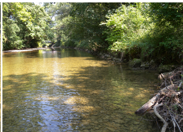
Abb. 3: Epipotamaler Abschnitt der Leiblach uh. Eisenbahnbrücke, Hörbranz (30), flussaufwärts, 13.08.2020.