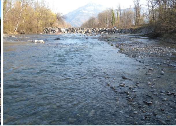
Abb. 7: Dornbirnerach, oh. Furt, Dornbirn (15), flussaufwärts, 30.03.2019.