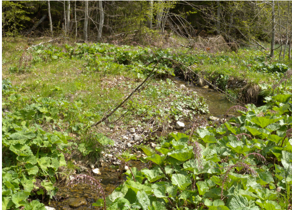
Abb. 4: Völkentobelbach, oh. Mündung in Bolgenach (61), Hittisau, bachaufwärts, 16.05.2019.