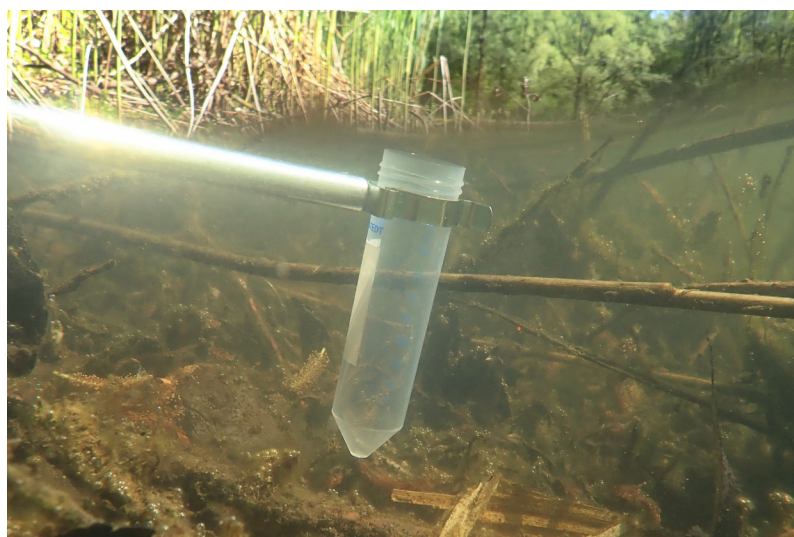
Abb. 2: Entnahme einer Wasserprobe zur Umwelt-DNA-Analyse: Mit einem speziellen Probennahme-Werkzeug werden aus einem oder aus mehreren Gewässern Wasserproben aus dem Uferbereich, in dem sich Amphibien am wahrscheinlichsten aufhalten, entnommen und in einer neuen, ungebrauchten PET-Flasche gesammelt. Die Anzahl der entnommenen Wasserproben steigt mit der Größe der Gewässer, es wird etwa alle 10 bis 20 m Uferstrecke, mindestens jedoch an drei bis fünf Stellen, eine Probe gezogen.

le jedoch nahezu unmöglich geworden. Eine exakte Bestimmung ist in der Regel nur mehr durch genetische Methoden möglich (INFO FAUNA – KARCH o. J.). Zur Feststellung der Artzugehörigkeit der in Vorarlberg vorkommenden Wasserfrösche wurden 2019 genetische Analysen mittels Umwelt-DNA (eDNA) durchgeführt. Für diese relativ neue Methode reicht eine Wasserprobe zur Bestimmung: Die vorkommenden Amphibien werden anhand der DNA-Spuren identifiziert, die sie in ihrem Wohngewässer hinterlassen (z. B. über Ausscheidungen, Drüsen-sekrete oder abgestoßene Haut). Wie bei anderen Erfassungsmethoden ist auch bei eDNA-Untersuchungen der Erfassungszeitpunkt wichtig, da eine Art nur nachgewiesen werden kann, wenn sie im Gewässer präsent ist bzw. bis maximal zwei Wochen nach dem Verlassen des Gewässers (vgl. HOLDER-EGGER et al. 2019; SCHMIDT & GRÜNIG 2017). Umwelt-DNA-Untersuchungen liefern Artnachweise, erlauben jedoch keine Aussagen zu Entwicklungsstadien oder zur Häufigkeit der vorkommenden Taxa. Zudem ist der Nachweis von Hybriden nicht möglich. Im Fall der Wasserfrösche bedeutet dies, dass