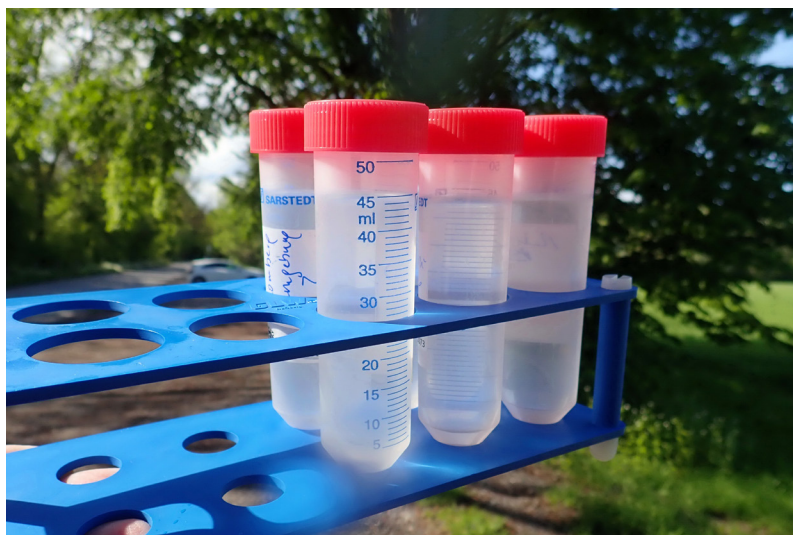
Abb. 3: Proben für die Laboranalyse. Aus der in der PET-Flasche gesammelten Mischprobe werden pro Untersuchungsstandort drei Proben für die Analyse im Labor gewonnen, indem vor Ort eine definierte Wassermenge mit einer Pufferlösung vermischt wird. Die Laborproben werden kühl transportiert und bis zur Übermittlung ans Labor tiefgekühlt.

Der Italienische Wasserfrosch zählt somit zur Vorarlberger Amphibienfauna. Die Ergebnisse deuten auf ähnliche Verhältnisse wie in der Schweiz: Die heimischen Wasserfroschformen wurden wahrscheinlich bereits im gesamten Vorarlberger Verbreitungsareal durch Italienische Wasserfrösche