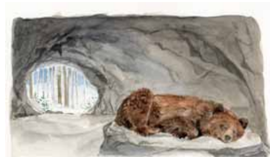
Die Bärenmama hat keineswegs mit Winterspeck zu kämpfen – im Gegenteil: Ohne genügend Speck gibt es keinen Nachwuchs.

Winterspeck macht Sinn, vor allem bei manchen Tierarten. Sie sammeln sich ihre