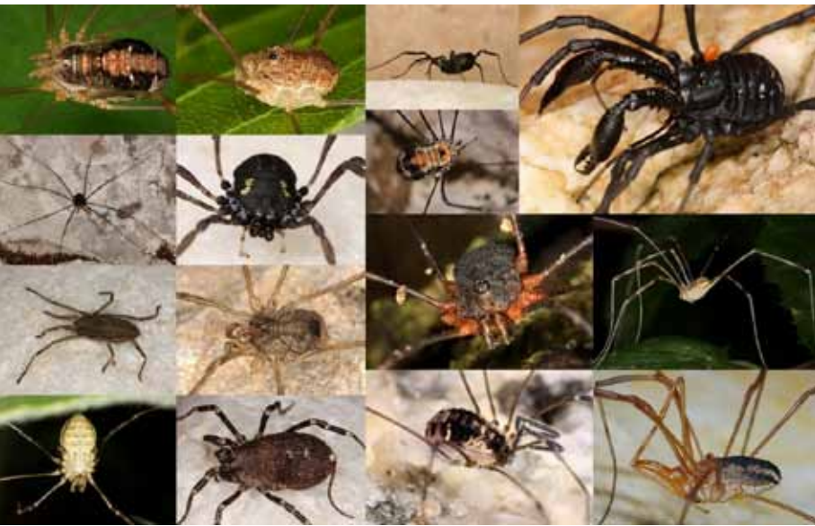
Die Vielfalt der heimischen Weberknechtfauna.

Ein kleiner, knopfförmiger Körper mit unendlich langen Beinen – so präsentieren sich die »klassischen« Weberknechte. Abgeflacht und mit Erdkrümeln bedeckt – bei Brettkankern fällt es schwer, sie mit ihren langbeinigen Verwandten in Beziehung zu setzen. Weberknechte sitzen an Hauswänden, an Felsen, unter Steinen, aber die meisten Arten leben versteckt in der Bodenschicht. Sie sind Räuber, und kleine Gliederfüßler sind ihre bevorzugte Beute. Ihre Nahrung finden sie auf abgestorbenen Pflanzenteilen, die von anderen Tieren gefressen und zersetzt werden. Mit wenigen Ausnahmen sind Weberknechte nachtaktiv.