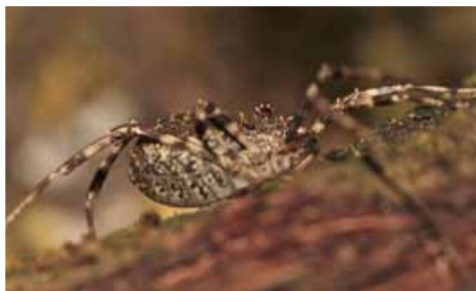
Der Steingrüne Zahnäugler ( Lacinius dentiger ) bewohnt lockere und lichte Waldgesellschaften und ist auch in Parklandschaften und Gärten zu finden.

Sieht man Weberknechte an den Außenmauern sitzen, so lassen sich auf den ersten Blick kaum Unterschiede erkennen. Doch bei genauerer Betrachtung zeigt sich bald: Die Vielfalt an Arten, Formen und Farben ist um ein Vielfaches größer als man vermuten möchte. Die zart gebauten Rückenkanker ( Leiobunum spp.) erreichen eine Spannweite von knapp 20 Zentimetern und sind damit die größten Landwirbellosen Europas. Massig und riesig sind die beiden heimischen Riesenweberknechte namens Gyas . Sie sind anspruchsvolle Bewohner von überhängenden und feuchten Felswänden. Selten sind Begegnungen mit spalten- und höhlenbewohnenden Scherenkankern. Das Auffinden dieser spektakulären Formen mit ihren überkörperlangen Brechzangen bleibt Arachnologen und Speläologen vorbehalten. Erdummantelte, abgeflachte Brettkanker besitzen einen ausgeprägten Totstellreflex. Sie sind