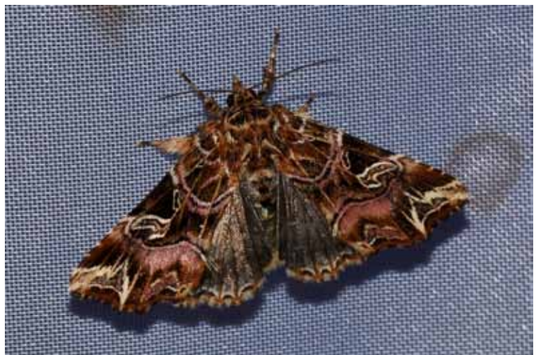
Heute wird die Adlerfarneule ( Callopietria juvenina ) in Lochau regelmäßig gesichtet.