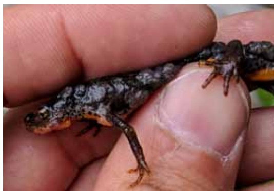
Epidermale Papillome am ganzen Körper