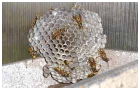
Die Gallische Feldwespe ist eine völlig harmlose Mitbewohnerin.

Erste Anlaufstelle für Wespenfragen ist die inatura-Fachberatung. Oft gelingt es ihr, eine temporäre Koexistenz von Menschen und Wespen zu erreichen. Die Biologie der Insekten liefert die nötigen Argumente dazu. Problematisch sind Nester der Deutschen und der Gemeinen Wespe, beide Arten bilden sehr große Völker mit tausenden Individuen. Die Nester anderer Arten sind nur in Einzelfällen kritisch, wenn sie an heiklen Standorten, wie z.B. in Jalousienkästen, angesiedelt sind.