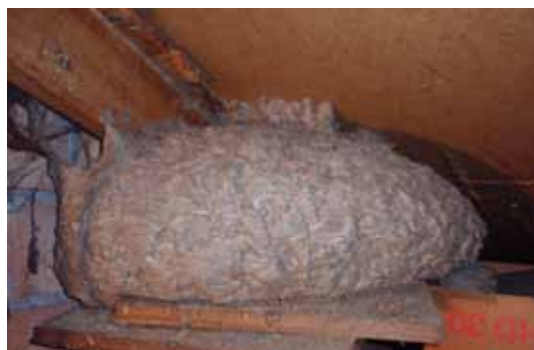
Derart große verborgene Nester baut nur die Deutsche oder die Gemeine Wespe.