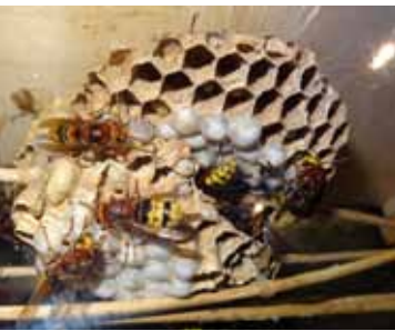
Hornissennest frisch nach dem Versetzen.

Wespen und Hornissen zählen zu den am meisten angefragten Tieren in der inatura-Fachberatung. Meist geht es um Nestbauten an Plätzen, wo sie als störend empfunden werden.