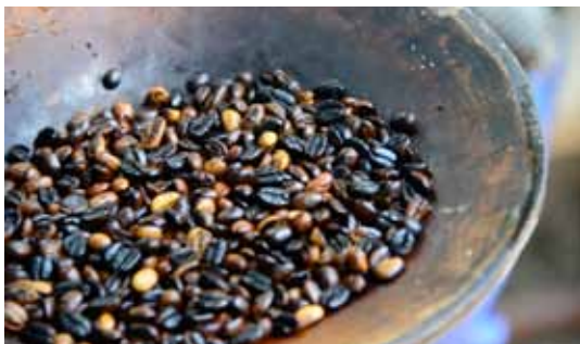
Die Ernte der Kaffeebohnen ist mit viel Handarbeit verbunden.