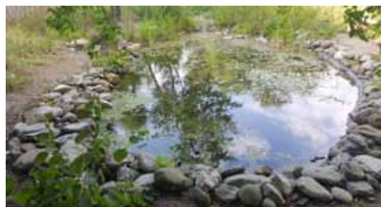
Der sanierte Teich im Frühjahr 2018

Ergebnisse der anatomisch-histologischen Untersuchungen sind zu finden: