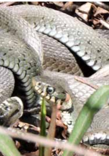
Nördliche Ringelnatter Natrix natrix natrix (Foto: Manfred Schlögel).

Im Nacken beiderseits je ein gelber Halbmond, vorne und hinten von schwarzen Flecken eingefasst – daran lässt sich die Ringelnatter leicht von den wenigen anderen Schlangenarten Mitteleuropas unterscheiden. Doch manchmal ist der Halbmond verwaschen milchig weiß oder gar grau, und ein kopfseitiger schwarzer Fleck ist nicht erkennbar. Erscheint die Schlange dann auch noch getigert, mit senkrechten schwarzen Barren an den Flanken, so stellt sich rasch Ratlosigkeit ein: Soll das wirklich noch eine Ringelnatter sein? Ja, selbstverständlich, sagen die einen. Nein, auf keinen Fall, meinen andere. Und irgendwie haben beide Recht.