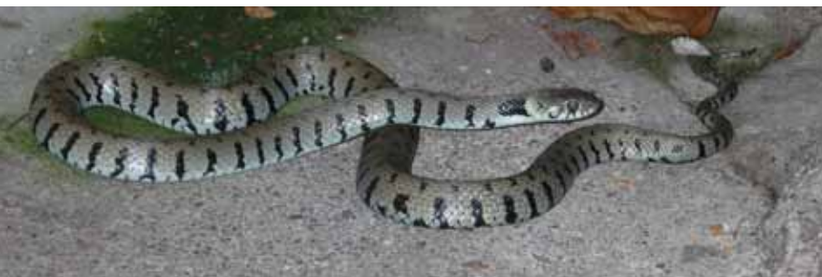
Ein wirklich auffallend gezeichnetes Exemplar der Barren-Ringelnatter.