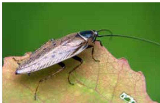
Gemeine Waldschabe ( Ectobius lapponicus )