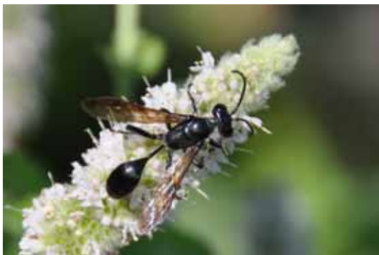
Mit dem Stahlblauen Grillenjäger ist eine weitere, faszinierende Tierart im Ländle angekommen, die nun unsere Fauna bereichert.