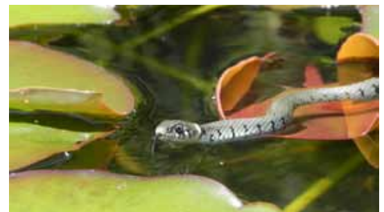
Ringelnattern sind gute Schwimmer und finden sich gerne im Gartenteich ein.