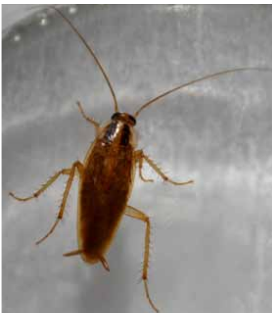
Deutsche Schabe ( Blattula germanica ) – flugunfähig, nachtaktiv, Hygiene- und Lebensmittelschädling. Deutlich sichtbare dunkle Streifen am Halsschild

Schaben sind unbeliebte Tiere, sie werden als gefährliche Hygieneschädlinge mit großem Ekelfaktor klassifiziert. Auf die Gruppe der Waldschaben trifft dies nicht zu. Waldschaben leben, wie ihr Name besagt, bevorzugt in Wäldern. Speziell den heimischen Gemeinen Waldschaben ( Ectobius lapponicus ) begegnet man kaum außerhalb von Wäldern, sie sind keine Kulturfolger. Anders verhalten sich die aus Südeuropa stammenden Bernstein-Waldschaben ( Ectobius vittiventris ). Diese flugfähigen Schaben verirren sich gerne in Wohnhäuser und verbreiten dort Angst und Schrecken – kein Wunder denn sie unterscheiden sich kaum von den gefürchteten Deutschen Schaben ( Blattula germanica ). Bernstein-Waldschaben ernähren sich von zersetzendem Pflanzenmaterial und lassen sich daher aus menschlicher Sicht den Nützlingen zuordnen. Die ursprünglich mediterrane Art hat sich in den letzten Jahren in Vorarlberg, der Schweiz und Süddeutschland etabliert. In heißen Sommern kann es zu Massenvermehrungen kommen. Dann verirren sich viele dieser flugfähigen, tagaktiven Tiere in Häuser und Wohnungen. Mangels Nahrung überleben sie dort nur wenige Tage, eine Bekämpfung mit chemischen Mitteln ist nicht erforderlich.