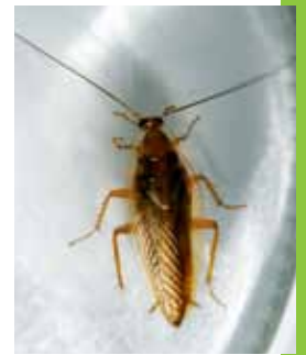
Bernstein-Waldschabe ( Ectobius vittiventris ) – flugfähig, tagaktiv, kein Schädling.