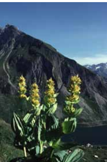
Der Gelbe Enzian ist Futterpflanze der Raupe des neu entdeckten Falters.

Manche Schmetterlingsarten entziehen sich der Forschung. Sie leben nicht wirklich im Verborgenen, aber sie verstecken sich hinter einer anderen, täuschend ähnlichen Art. Erst Zufälle klären die Verwechslung auf. Doch dann ist die Überraschung groß: Fotos dreier Falter erweisen sich als Erstnachweis einer neuen Art für Österreich!